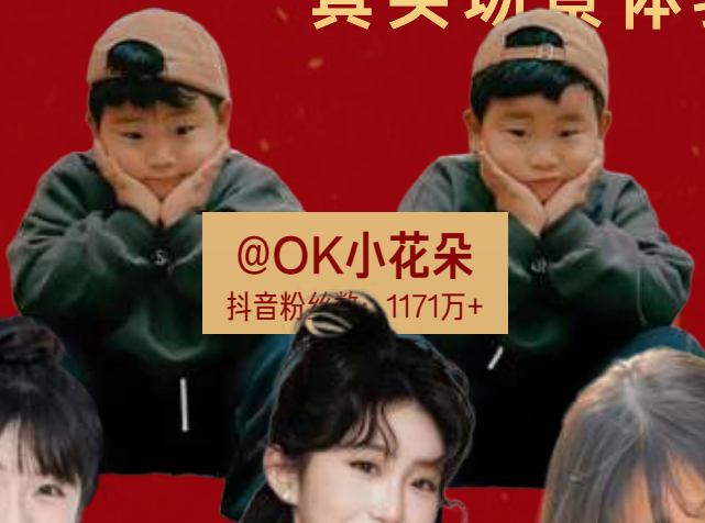
@OK小花朵 抖音粉丝数: 1171万+