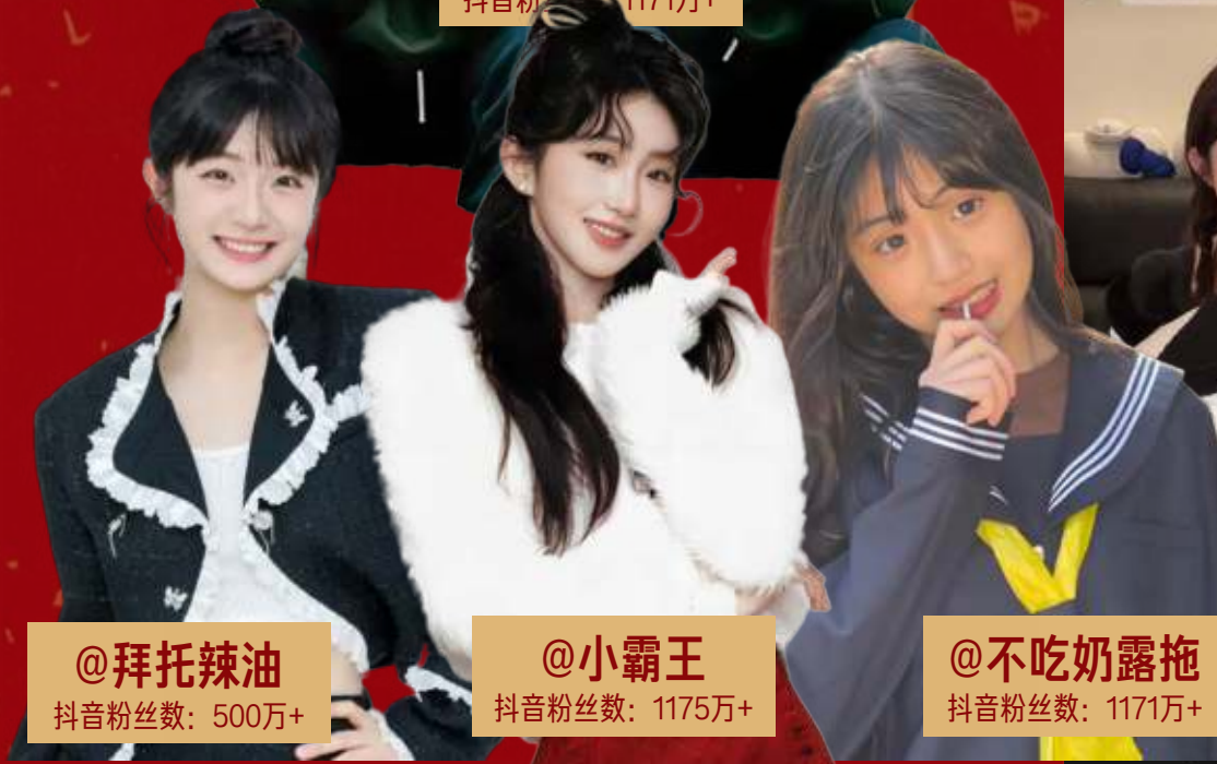
@拜托辣油 抖音粉丝数: 500万+