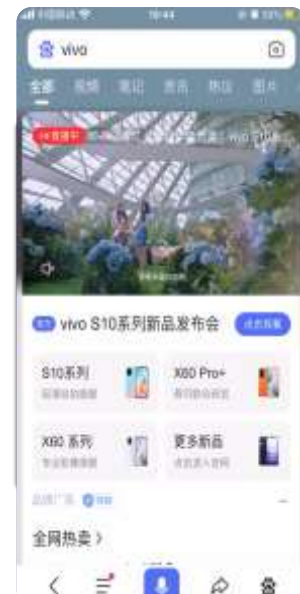
超级品专直播样式 点击播放视频