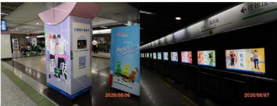
上海L2陆家嘴站：站台包柱+5联灯箱