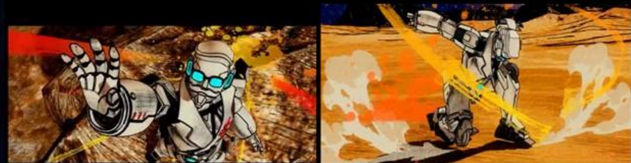
大宝剑：是我的天赋！