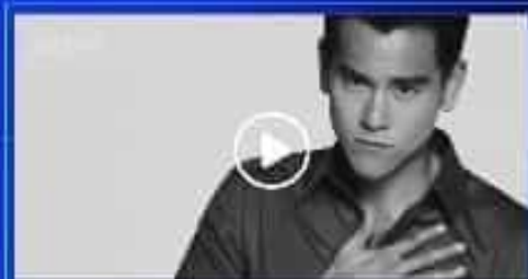
男神：至尊引领轻奢潮流