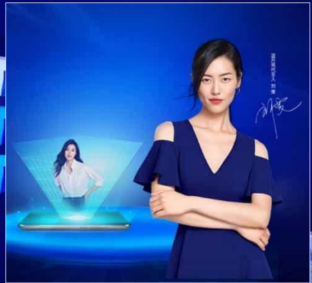
AR黑科技体验刘雯洗衣新风尚